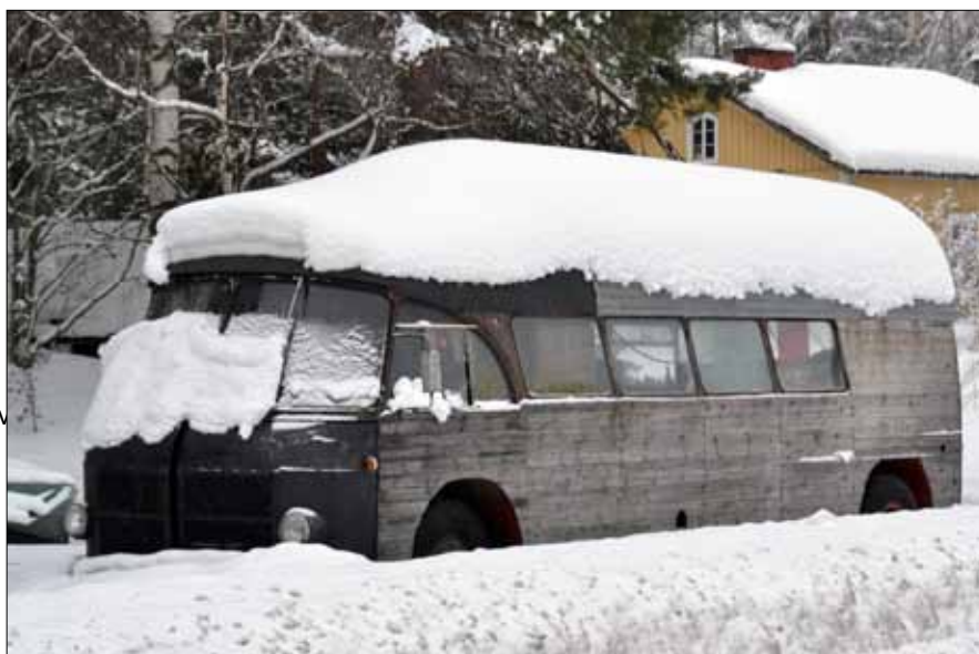
Talvi tulee yleensä aina jossain muodossa. Ja voi joskus yllättää jopa ammattilaisen...