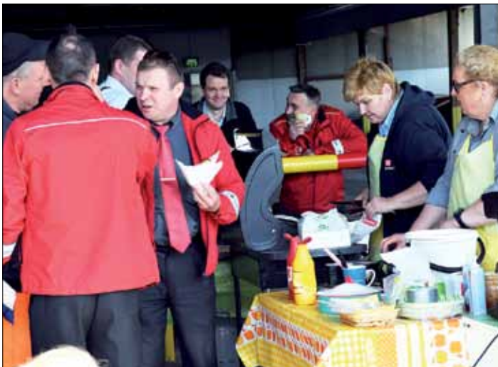
Makkara maistui Espoossa...